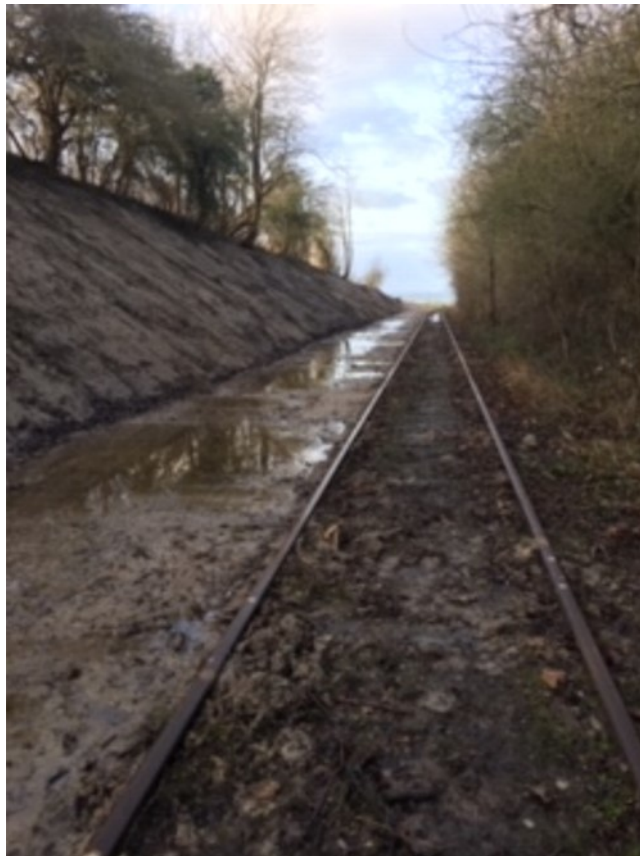
Strækningen mellem Torø Huse Vej og Egebjergvej

En vandretur på jordbassinerne i sept. sluttede inde ved P-pladsen, hvor Assens Forsyning var i gang med at nedlægge nye kloakrør og nu afslørede en dejlig planeret rute. Idéen om "bare lige at lægge en belægning på" stod lysende klart. Nu var der banet vej for at skabe en billig natursti for vandrere, løbere, cyklister og skabe både en god transportvej for de bløde trafikanter og gode naturoplevelser for alle, som vil dette.